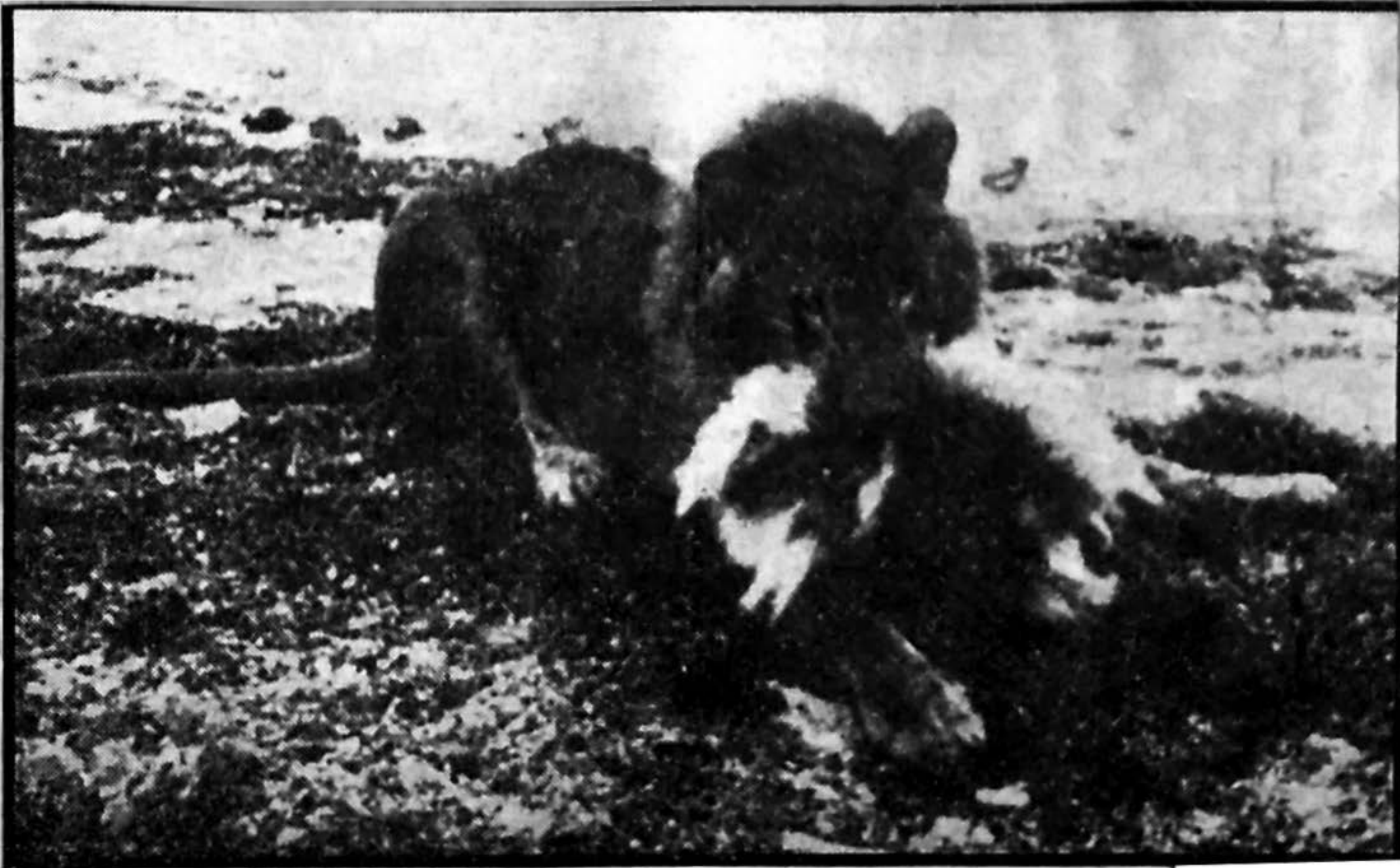
Den historiske scene fra »Løvejagten paa Elleore« — løven napper geden.