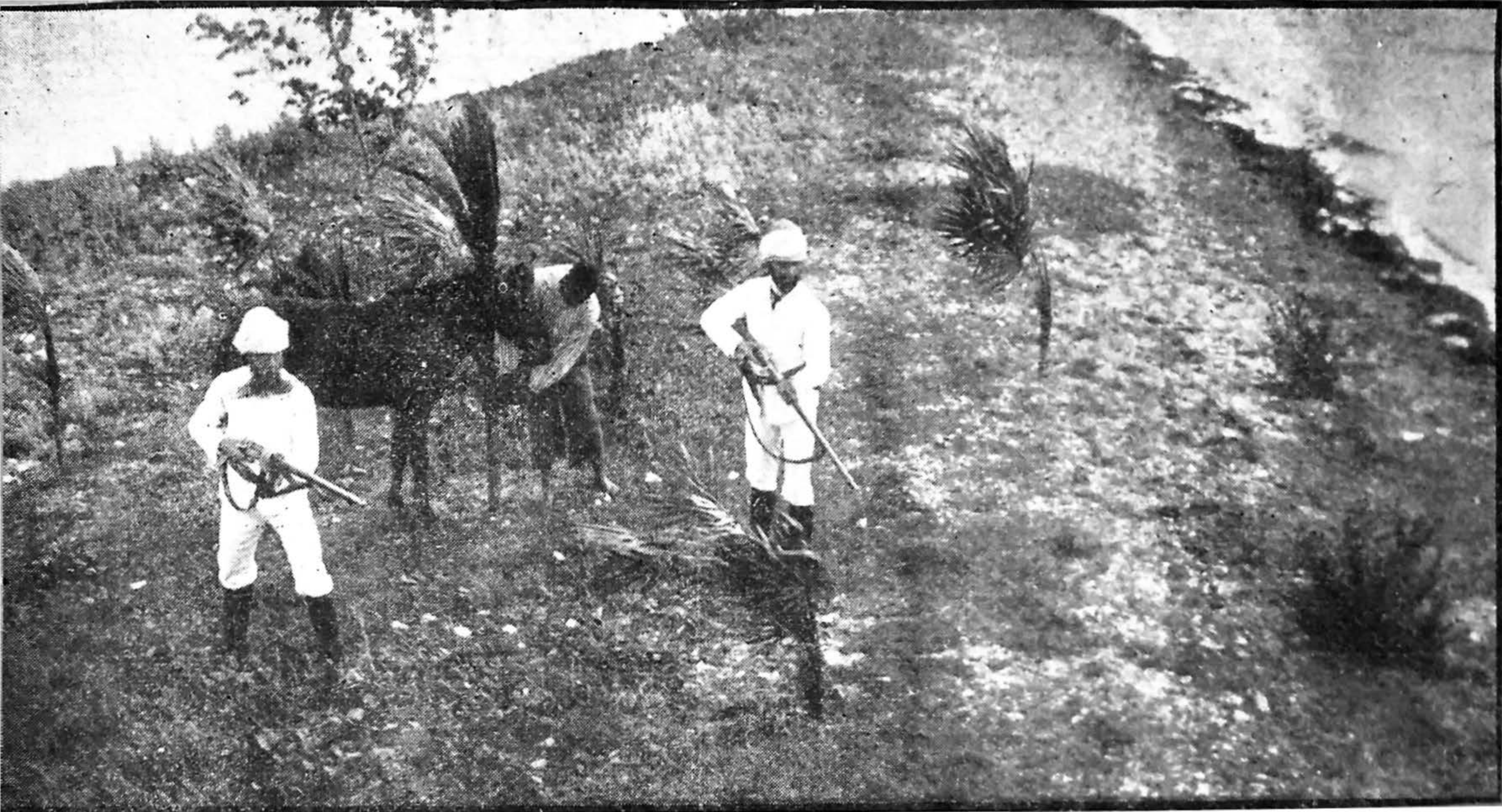
Indkøbte palmer forvandlede efter bedste evne Elleore til en tropeø.