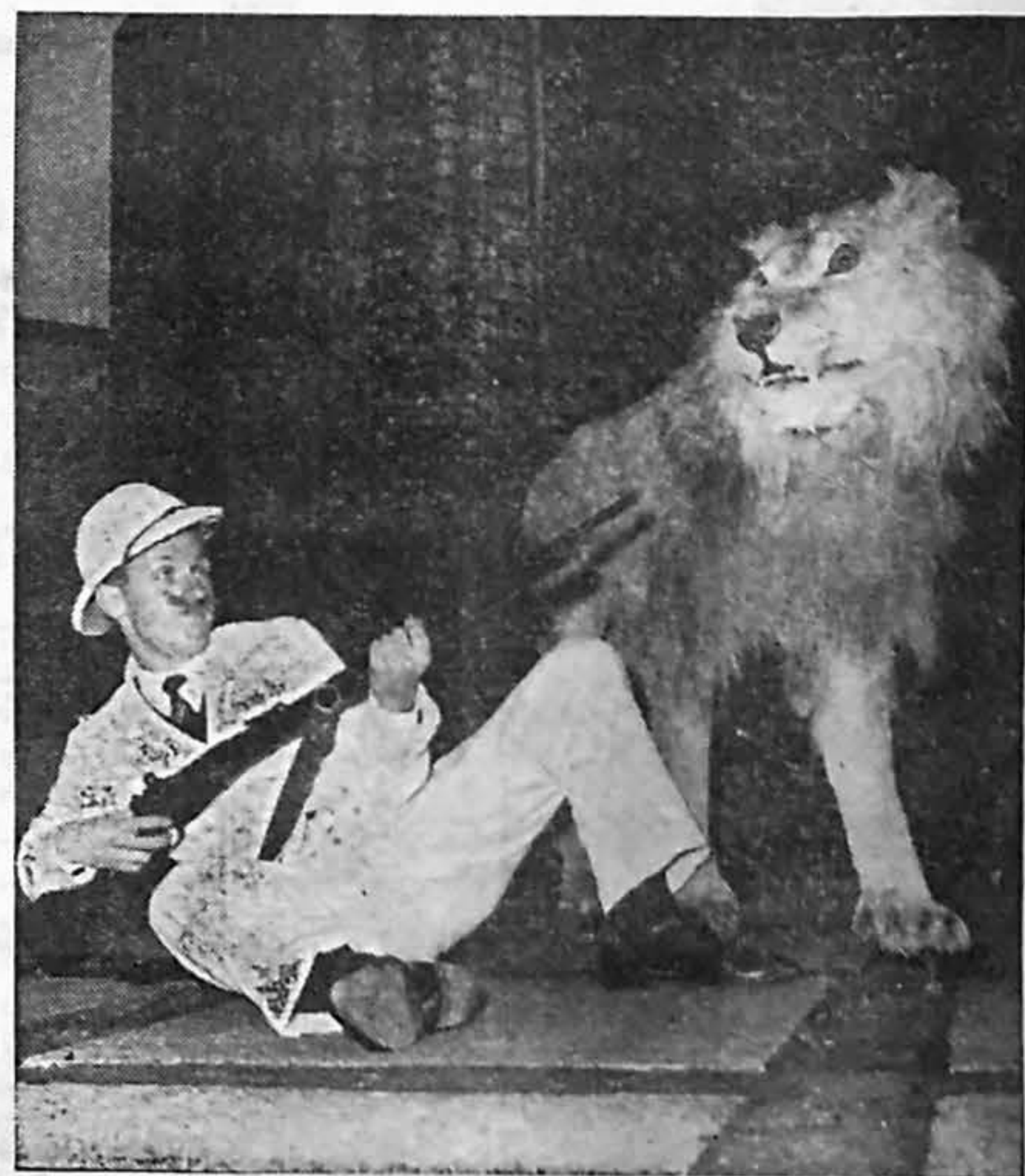
En af storvildtjægerne i en nervepirrende situation. Løven — udlånt fra Zoologisk Museum — tog det hele med stoisk ro. Den har været udstoppet i næsten 100 år.