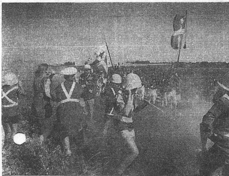
Da kamphandlingerne var på deres højeste og bølgede frem og tilbage, som historiske slag skal gøre det.