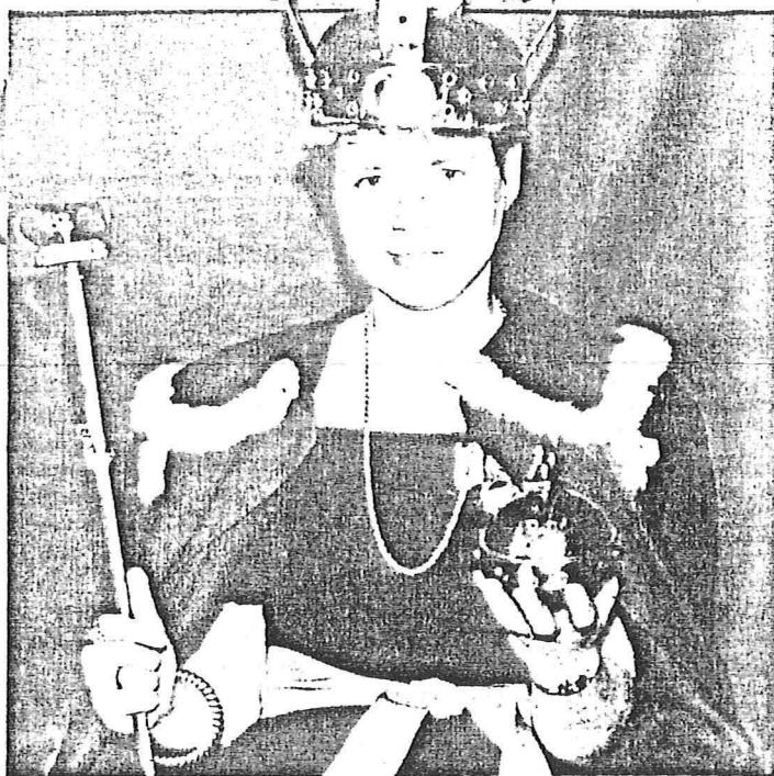
Dronning Leodora af Elleore med alle regalerne.

Kroningen fandt sted i lørdags på Killegård Slot (til daglig Killegård Gymnasium i Gentofte), som i dagens anledning lå badet i lys. Omkring 200 af Elleores borgere trodsede 20 graders frost og var mødt op for at hylle deres nye dronning. Der var sabelraslen og medaljekirren i foyeren på