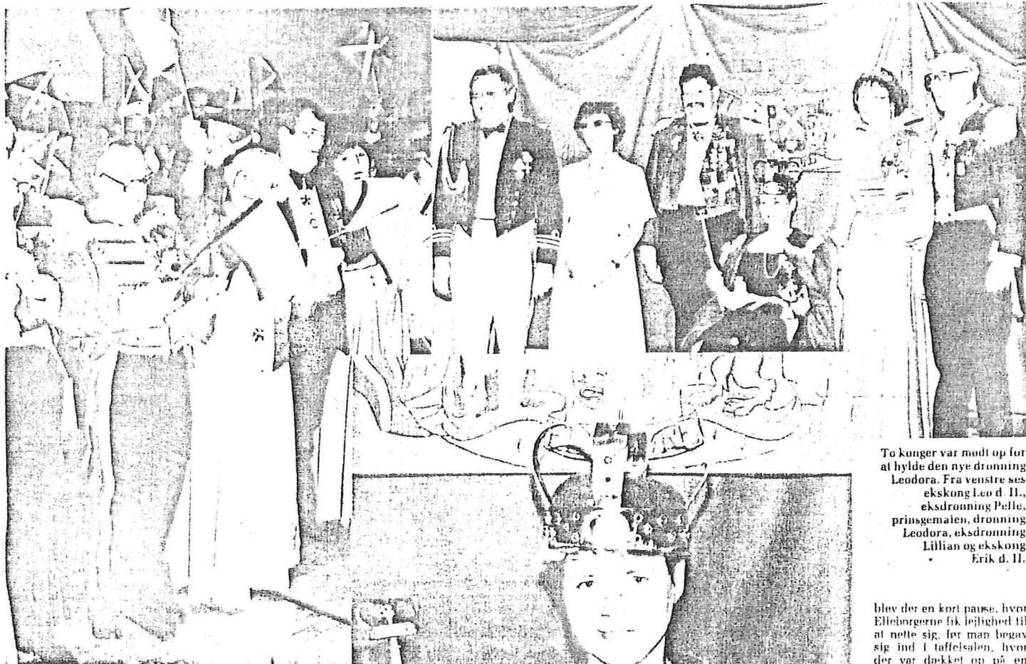
To konger var mødt op for at hylle den nye dronning Leodora. Fra venstre ses ekskong Leo d. II., eksdronning Pelle, prinsgemalen, dronning Leodora, eksdronning Lillian og ekskong Erik d. II.

Jubelen brød løs, da kroningen af Leodora var forbi. Elleborgerne svingede med Ellebrog, det røde flag med et hvidt kryds.