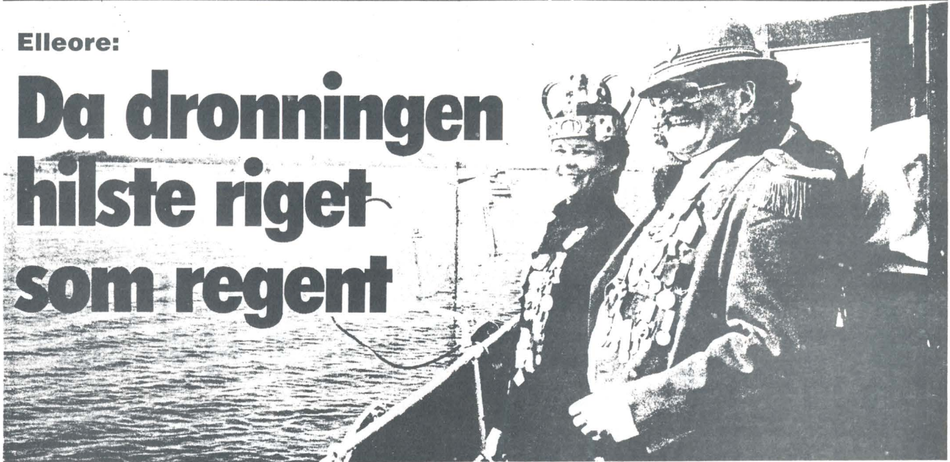
Elleore i sigte.