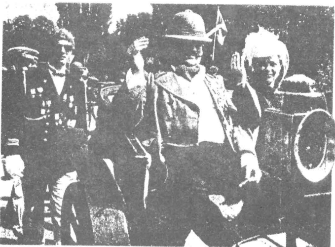
Fra den kongelige karet hilser Dronning Leodora og Prindsen på folket.