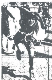
Hofnarrens rolle er at forny Dronningen.

Begivenheden startede på Københavns Hovedbanegård, hvor man efter en kort ceremoni gik ombord i den kongelige salonvogn, som klokken 13.59 ankom til Roskilde Station. Da Dronningen og Prindsen