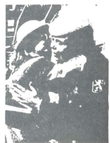
Et kys på kinden af den yngste generation af Ellefolket.

Ombord blev der serveret en forfriskning, og der blev også tid til den officielle fotografering, inden man igen stævnede mod Roskilde havn. Inden landgangen var der uddeling af ordner til skibets besætning for veludført sømandsskab. Der faldt også en medalje af til pressen.