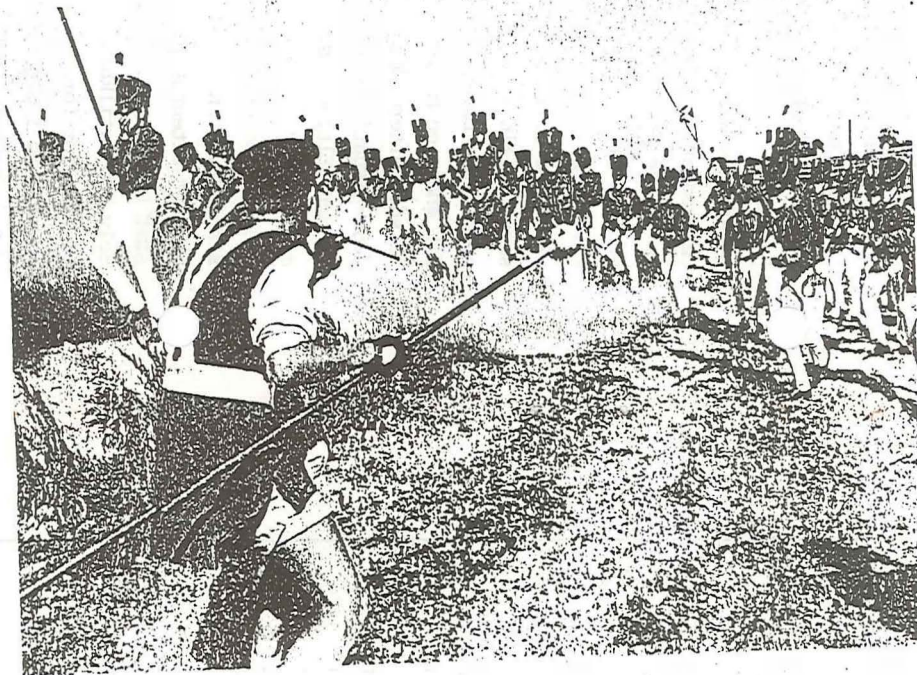
Elleore har endda sit eget frygtindgydende militær.

viklet en højstående hattekultur, der spænder lige fra tropeljelum til hat med slør. Med særlig glæde paradere de i år Majestæten med en fornem gave fra sit ydmyge folk: en klaphat i ægte elliske larver.