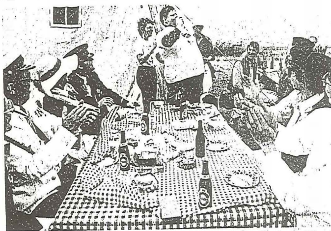
Elleore-folket går særdeles officielt til værks efter protokollen, og det skorter ikke på meget fine titler, men de når da også frem til det væsentlige i tilværelsen, nemlig fast og flydende føde.

Den gemene hov senerer søgende og beundrende blikke efter det, som dronningen har sat på hovedet. Majestæten har nemlig ud-