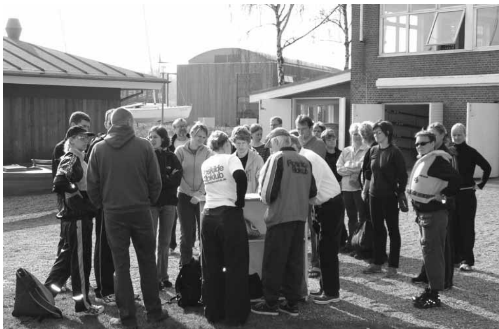
En tur rundt om Elleore kræver forberedelse, bl.a. om ruten og de forskellige geografiske mærkværdigheder på øen.

af buketorn, som sammen med skovfyr og hylde udgør øens vedplantevegetation. Nogle små saltpåvirkede vandhuller findes i det vestlige engareal.