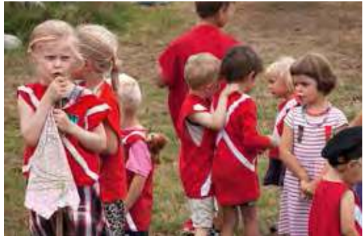
» Barnen som deltar under Elleveckan varvar skolgång med lek.