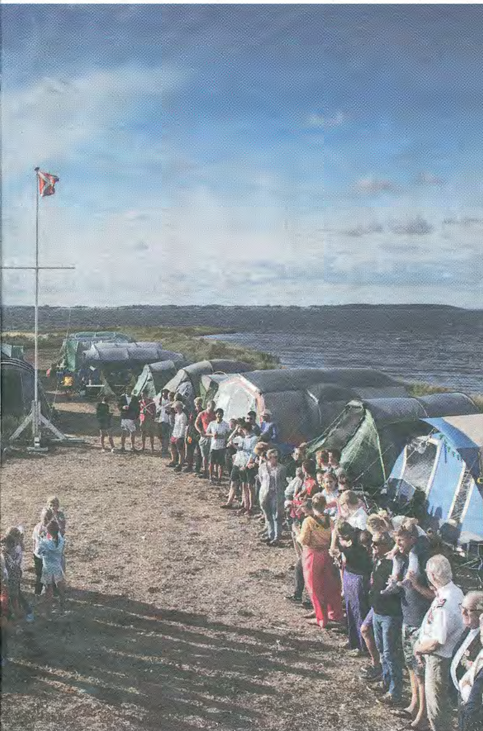
Elleborgerne stiller op til samling tre gange om dagen.