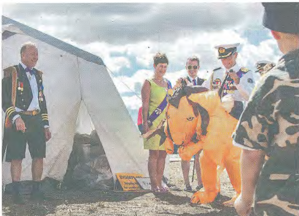
Det er kongens fødselsdag, og i år får han en løvedragt i fødselsdagsgave.